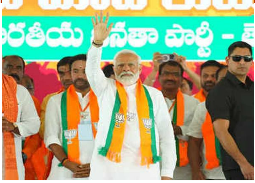
హైదరాబాద్ మన జనప్రగతి మార్చి 18:- తెలంగాణలో బీజేపీకి ఎన్ని సీట్లు ఎక్కువ వస్తే... తనకు అంత శక్తి వస్తుందని ప్రధాని మోదీ అన్నారు. పార్లమెంట్ ఎన్నికల షెడ్యూలు వెలువడిన తర్వాత రాష్ట్రంలో తొలిసారి నిర్వహిస్తున్న జగిత్యాల విజయంకల్ప