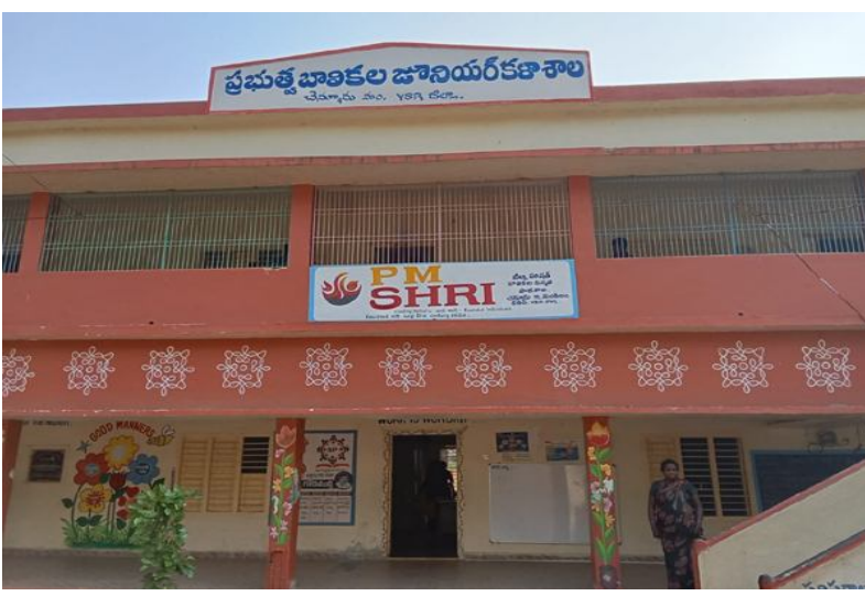
ఇబ్బందులు కలగకుండా అన్ని ఏర్పాట్లను చేసినట్లు మండల విద్యాశాఖ అధికారి తెలియజేశారు

చెన్నూరు మన జనప్రగతి మార్చి 18:- మండలంలో జరుగుతున్న వడవ తరగతి పరీక్షలు సోమవారం అధికారులు పకడ్డందీగా నిర్వహించారు, జిల్లా పరిషత్ బాలికల ఉన్నత పాఠశాల, ఆర్ ఆర్ పాఠశాల లోని రెండు కేంద్రాలలో మొత్తం 351 మంది విద్యార్థులకు గాను 344 మంది విద్యార్థుల హాజర్ పరీక్షలు రాయడం జరిగింది, కాగా ఏడు మంది విద్యార్థులు వివిధ కారణాలవల్ల పరీక్షకు హాజరు కాలేదు, ఆర్ ఆర్ పాఠశాలలో 168 మంది విద్యార్థులకు గాను 167 మంది విద్యార్థులు హాజరుకాగా, ఒకరూ గ్రౌండ్ జరయ్యూరు, అదేవిధంగా జిల్లా పరిషత్ బాలికల ఉన్నత పాఠశాల లో 183 మంది విద్యార్థులకు గాను 177 మంది విద్యార్థులు పరీక్షలకు హాజరయ్యారు, 6 మంది విద్యార్థులు గ్రౌండ్ జరయ్యూరు, విద్యార్థులకు ఎటువంటి