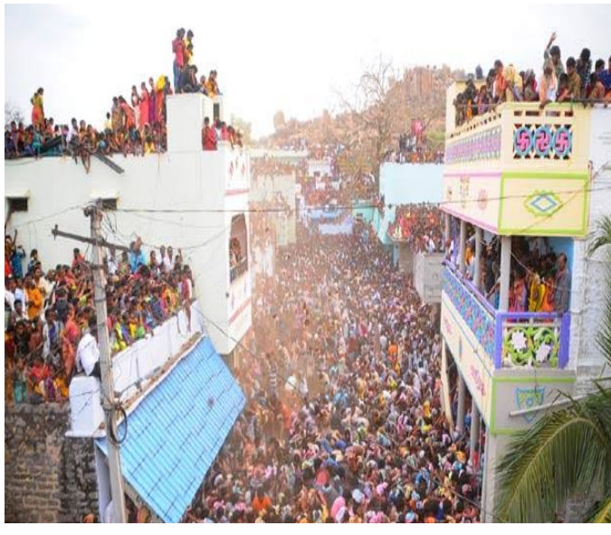
అలయంలో ఇద్దరు విగ్రహాలను ఏర్పాటు చేసి వారికి కల్పాణం జరిపిస్తామని బ్రాహ్మ దేవుడు మాట ఇచ్చినట్లు ఆలయ చరిత్ర చెబుతోంది స్వామి వార్లకు అత్యంత భక్తి శ్రద్ధలతో కొలిచే వారు పిడకల సమరం జరిగి కొన్ని నిమిషాలకు ముందు ప్రత్యేక పూజలు నిర్వహించేలా చూడాలని కూడా

ఇరువర్గాలను శాంతింపజేశారని చెబుతారు. పిడకల సమరంలో దెబ్బలు తగిలిన వారు భద్రకాళి అమ్మవారు వీరభద్ర స్వామి వార్ల ఆలయాలకు వెళ్లి సమస్యారం చేసుకొని అక్కడ ఆయా ఆలయాల్లో ఉన్న వీధుతిన ఇరువర్గాల భక్తులు రాసుకుని రావాలని బ్రాహ్మ ఆదేశిస్తాడు ఆ తర్వాత ఒకే ఆలయంలో ఇద్దరు విగ్రహాలను ఏర్పాటు చేసి వారికి కల్పాణం జరిపిస్తామని బ్రాహ్మ దేవుడు మాట ఇచ్చినట్లు ఆలయ చరిత్ర చెబుతోంది స్వామి వార్లకు అత్యంత భక్తి శ్రద్ధలతో కొలిచే వారు పిడకల సమరం జరిగి కొన్ని నిమిషాలకు ముందు ప్రత్యేక పూజలు నిర్వహించేలా చూడాలని కూడా