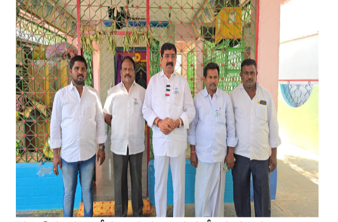
ప్రజాభిమానం, దేవుని దయ ఆయన మీద వుండటం వలననే ఆయనకు పెను ప్రమాదం తప్పిందన్నారు.